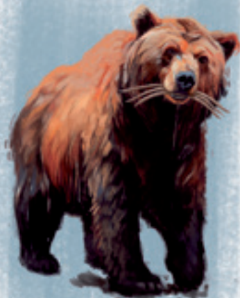
Bär Daniel 7,5

„Ich schaute in meiner Erscheinung bei Nacht, und siehe, die vier Winde des Himmels peitschten das große Meer. Und vier große Tiere stiegen aus dem Meere, verschieden eines von dem anderen.