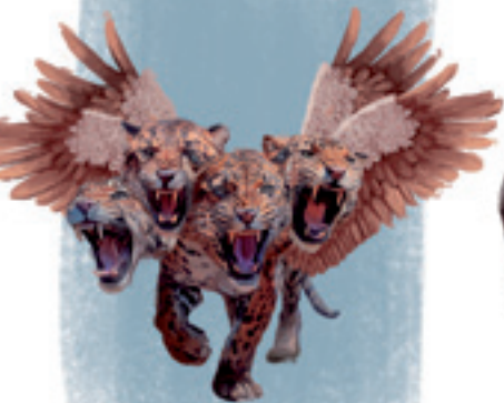
Leopard Daniel 7,6