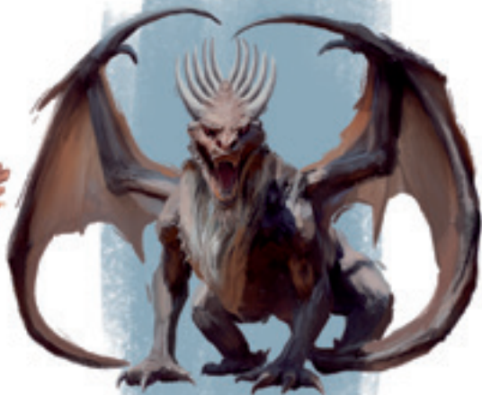
Schreckliches Tier Daniel 7,7

Nach diesem schaute ich in den Erscheinungen der Nacht, und siehe, ein viertes Tier, ein schreckliches und furchtbares und überaus starkes, das große Zähne von Eisen hatte; es fraß und zermalmte, und den Überrest zerstampfte es mit seinen Füßen, und es war verschieden von all den Tieren, die vor ihm gewesen, und es hatte zehn Hörner.