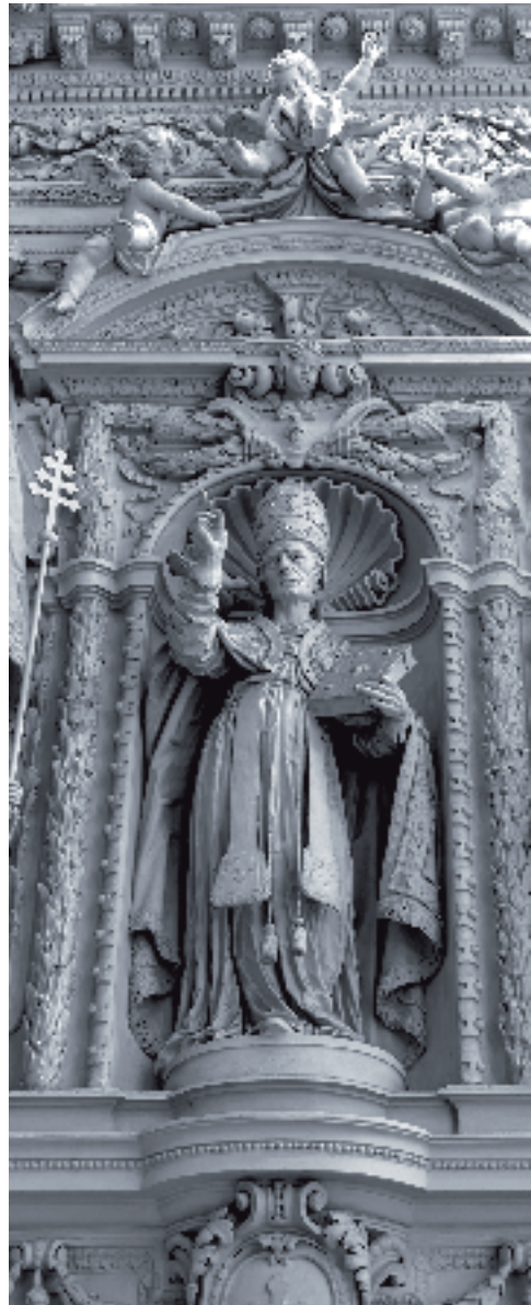
Das Innere der Theatinerkirche in München; ein Beispiel für den Prunk des Heiligen Römischen Reiches.

Nach der Teilung des Römischen Reichs und seiner Eroberung durch die germanischen Stämme tauchte ein anderes Reich auf, das drei dieser Stämme besiegte: die Vandalen, die Ostgoten und die Westgoten – so wie Daniel 7 es vorhergesagt hatte. Diese drei Stämme regierten in Teilen Nordafrikas, Italiens und Osteuropas. Wer unterwarf sie? Es war König Justinian, der Herrscher des Heiligen Römischen Reiches. Dieses Reich