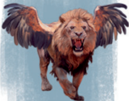
Löwe Daniel 7,4

eine religiös-politische Macht hinzu, die bis heute versucht, die Bedeutung des Schabbits zu schmälern.