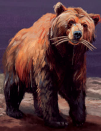
Oso Daniel 7:5