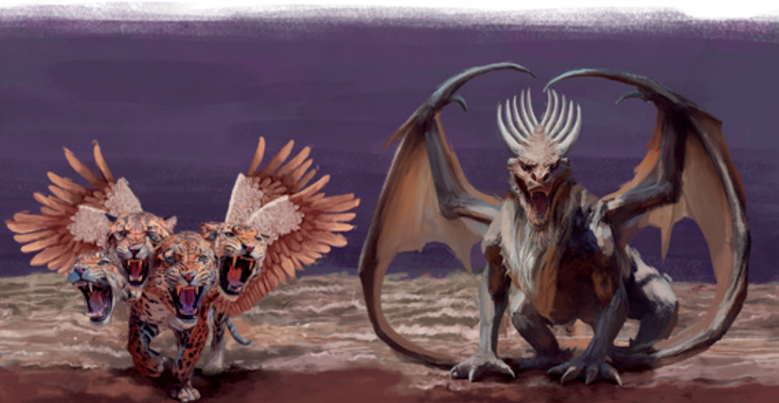
Leopardo Daniel 7:6

Sobre la base de la sucesión de los imperios mundiales, el leopardo debe representar a Grecia. “Le fue dado dominio”, así como Daniel 2:39 dijo que “dominará en toda la tierra”. También tenía cuatro alas, que representaban la velocidad con la que conquistó todo el mundo conocido en aquel entonces. Sus cuatro cabezas simbolizaban a los cuatro generales que gobernaron Grecia tras la muerte de Alejandro Magno. 2 Este hecho lo confirma una profecía de Daniel 8 que igualmente indica que la nación de Grecia siguió a Medopersia; y hasta menciona a Grecia por su nombre (Daniel 8:20, 21).