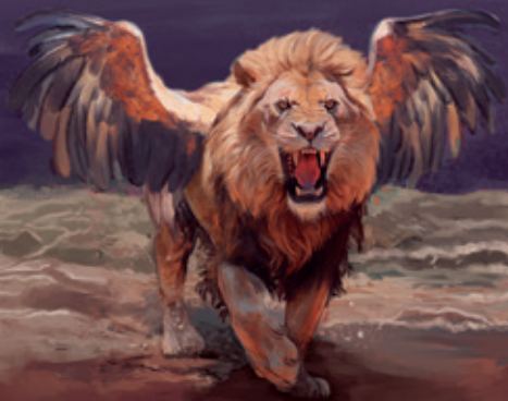
León Daniel 7:4