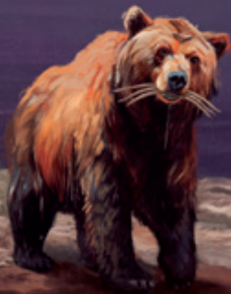
Oso Daniel 7:5