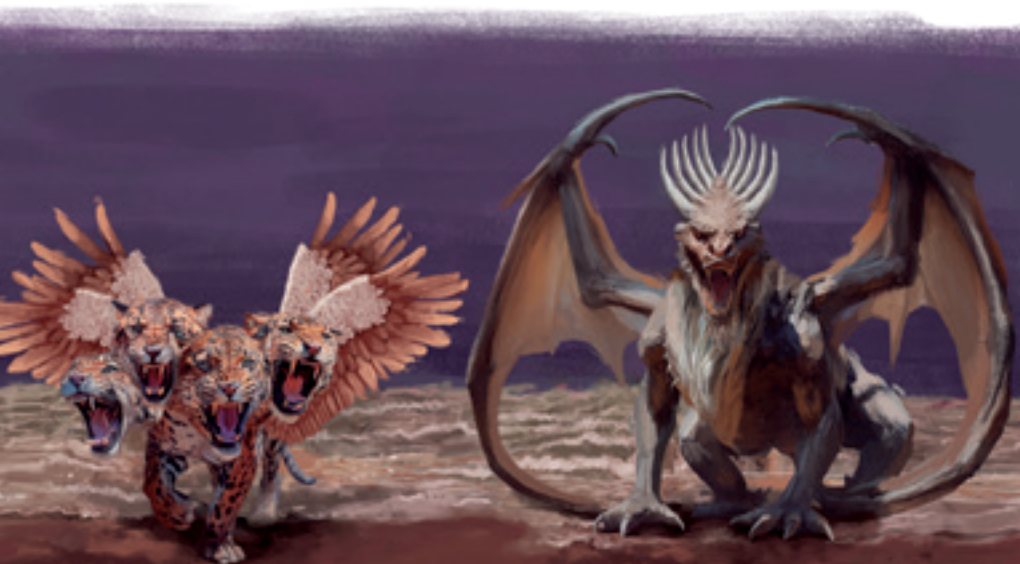
Leopardo Daniel 7:6

Sobre la base de la sucesión de los imperios mundiales, el leopardo debe representar a Grecia. “Le fue dado dominio”, así como Daniel 2:39 dijo que “dominará en toda la tierra”. También tenía cuatro alas, que representaban la velocidad con la que conquistó todo el mundo conocido en aquel entonces. Sus cuatro cabezas simbolizaban a los cuatro generales que gobernaron Grecia tras la muerte de Alejandro Magno. 2 Este hecho lo confirma una profecía de Daniel 8 que igualmente indica que la nación de Grecia siguió a Medopersia; y hasta menciona a Grecia por su nombre (Daniel 8:20, 21).